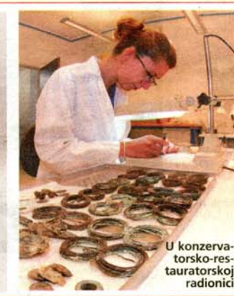
U konzervatorsko-restauratorskoj radionici