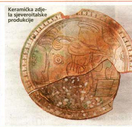
Keramička zdjela sjeveroitalske produkcije