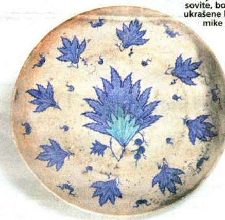
Primjerak glasovite, bogato ukrašene keramike iznik