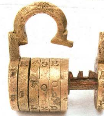
Mjedeni katanci funkcioniraju i danas