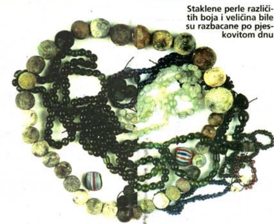
Staklene perle različitih boja i veličina bile su razbacane po pjeskovitom dnu