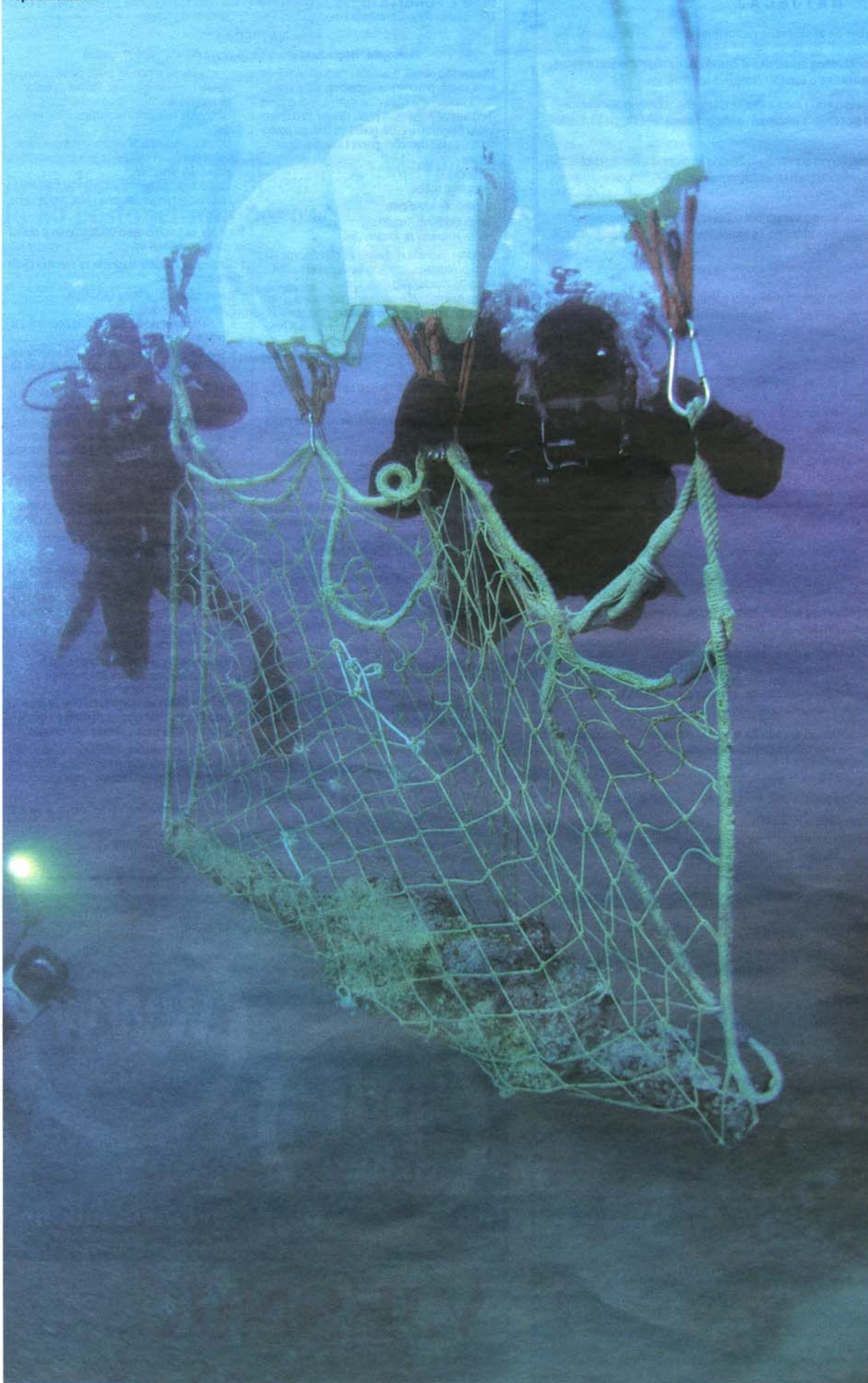
Podizanje brončanog topa s nalazišta