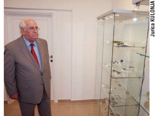
Božo Biškupić, ministar kulture RH, u Zadru je došao nakon konferencije UNESCO-a u Abu Dhabiju

Sadržaj seminara koncipiran je u tri tematska dijela, ratifikacija i implementacija UNESCO-ve konvencije o podvodnoj arheološkoj baštini u zemljama Istočnog Mediterana i jugoistočne Europe, dosadašnja postignuća u zaštiti podvodnih kulturnih dobara i primjeri međunarodne suradnje i buduće aktivnosti Međunarodnog centra za podvodnu arheologiju – UNESCO-vog regionalnog centra II kategorije u Zadru.