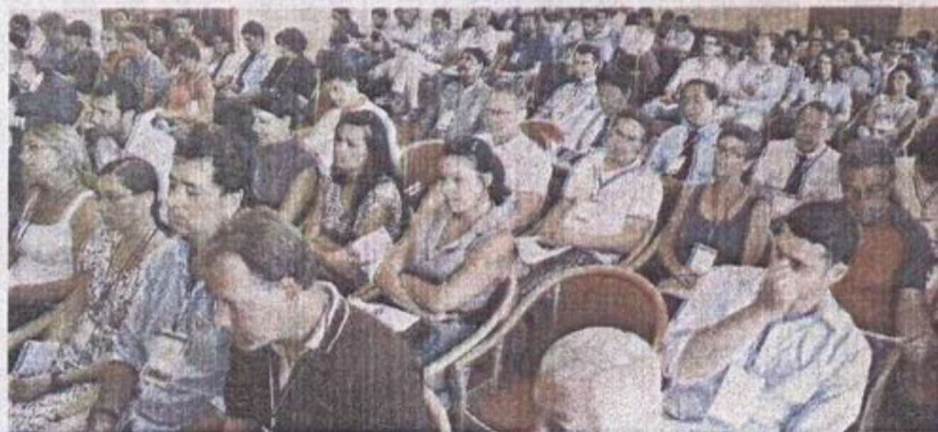
Na kongresu sudjeluje oko 300 stručnjaka iz cijelog svijeta

- Na ovaj način predstavljamo zadarsko Sveučilište na najbolji mogući način.