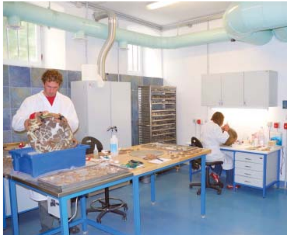
Dio istraživanja obavlja se i u laboratorijima