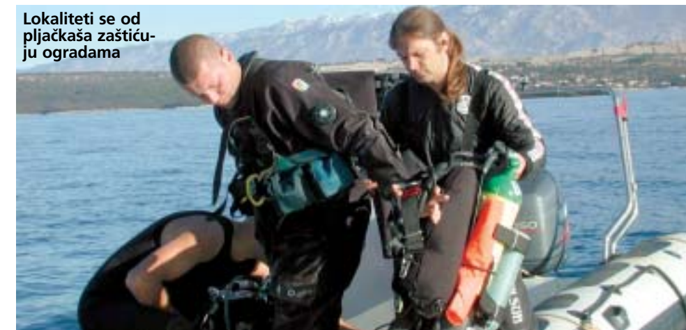
Lokaliteti se od pljačkaša zaštićuju ogradama