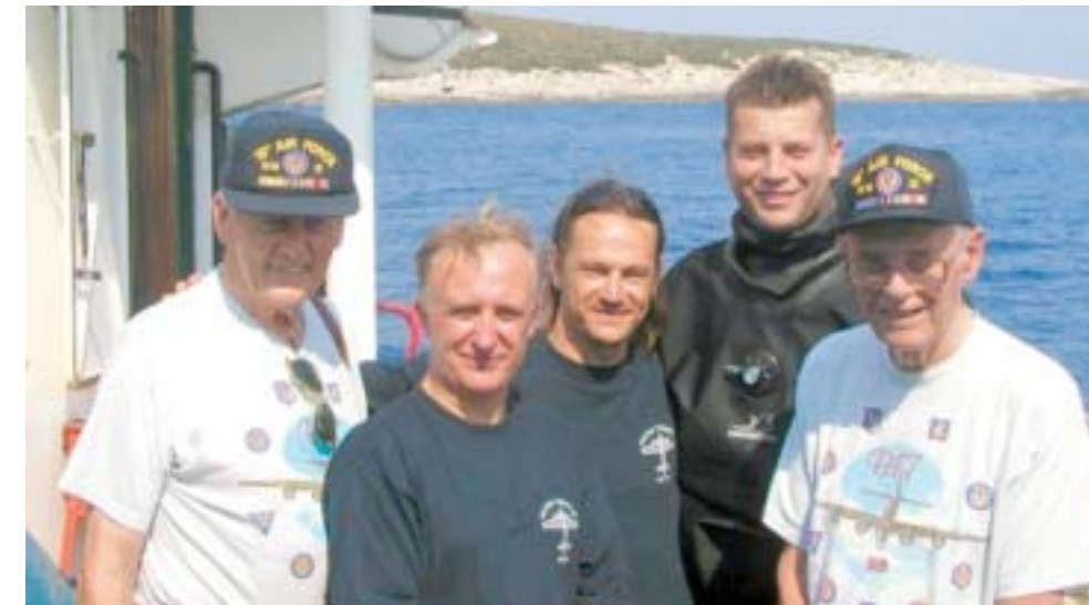
Na jednom od opvodnih lokaliteta

Govoreći o najznačajnijim podmorskim lokalitetima u Hrvatskoj, Mesić kaže da se ponekad lokaliteti, koji su turistički atraktivni za ronjenje, poklapaju i s arheološkom vrijed-